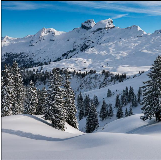
Schnee, Eis und Kälte