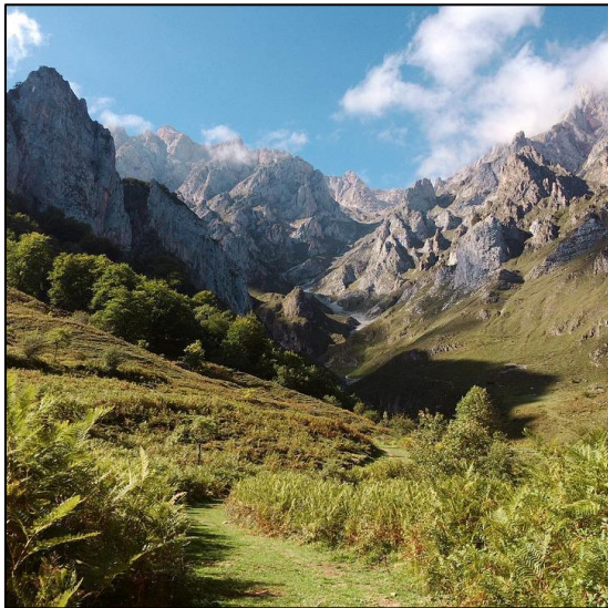
mountains, rolling hills